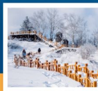
เขาเกาะหลู่