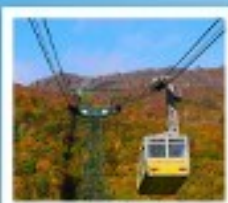
ภูเขาไฟอุสุ