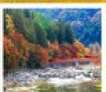
ฟูจิซังโกลด์

ฮารุชิยาม่า / ไบบะ / สวนทามะฮารุ / 50ฟุคุงุ / 50ฟุคุมิชิ / ปราสาทโทโกะ / ไบบะ / ฟูจิซังโกลด์ / ฟูจิซังโกลด์ / ฟูจิซังโกลด์ โงชิโนะ ฮิโกะ / สวนโงชิโนะ / ฮิโกะฮิโกะ / 50ฟุคุงุ / 50ฟุคุงุ / 50ฟุคุงุ