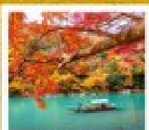
ฮารุชิยาม่า