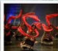
โรว์ฟิเบต