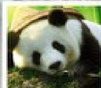
ดูแม่กับหนูน้อย

อุทยานหวงหลง / อุทยานจิ่วจ้ายโกว / ไร่วิทีเบตดูแม่กับหนูน้อยแพด้าดูเจียงเซี่ย / สวนดอกไม้ทิ่กูว / ระเบิดงเท่ว / ถนนถนนเดินฮือปิ่ง / ถนนโปลงร้านฮือปิ่ง