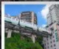
ตึกเมืองตง

ทัวร์คุณภาพ ไม่ลงร้านฮ้อปปีง • ไม่ขายออฟชั่น