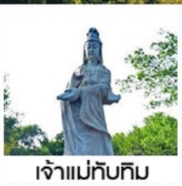
เจ้าแม่ทับทิม