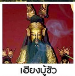
เอียงบู๊ซิว