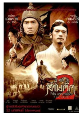
ภาพยนตร์และซีรีส์ชื่อดัง ถ่ายทำที่ Hengdian World Studios