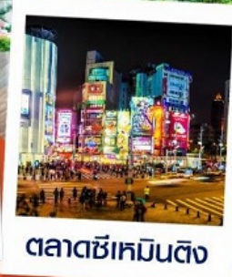
ตลาดซีเหมินติง