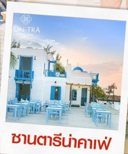
ชานตารีน่ากาแฟ