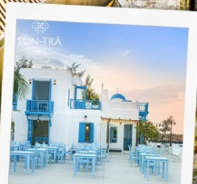
ซานตารีน่าคาเฟ่