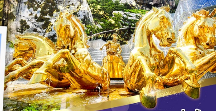
ราคาเริ่มต้น