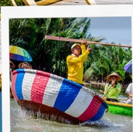
เรือกระดิง