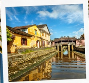
เมืองโบราณฮอยอัน