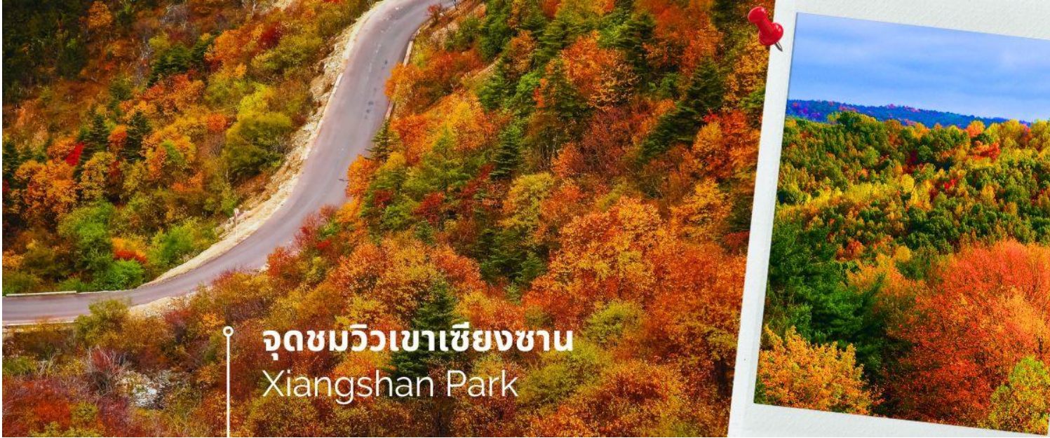
จุดชมวิวเขาเซียงซาน Xiangshan Park

(ระหว่างเดือน ตุลาคม-พฤศจิกายน ของทุกปี) นำท่านชม ใบไม้เปลี่ยนสีที่เซียงซาน จุดชมวิวเขาเซียงซาน(Xiangshan Park) หรือเรียกกันในภาษาอังกฤษว่า Fragrant Hills Park สถานที่ท่องเที่ยวสวยงามในระดับ 4A ตั้งอยู่ในเขตซานเหมิงทางตะวันตกของปักกิ่ง เป็น 1 ใน 4 จุดสำหรับชมใบไม้เปลี่ยนสี ใบไม้สีแดงของ