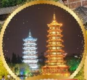
เจดีย์เงิน เจดีย์ทอง