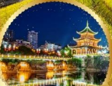
ตึกเซียวเหยา