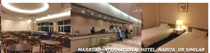
MARROAD INTERNATIONAL HOTEL, NARITA OR SIMILAR