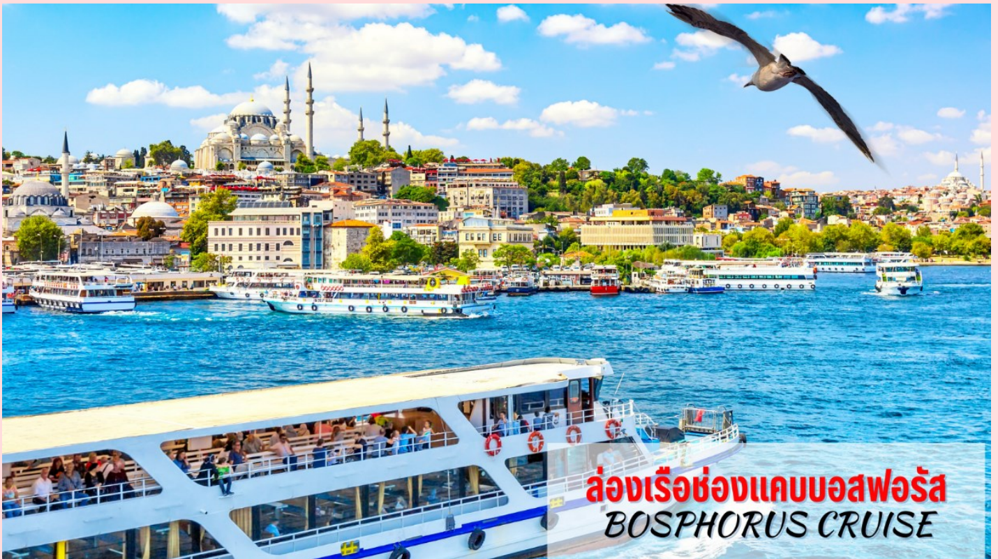
ล่องเรือชมช่องแคบบอสฟอรัส BOSPHORUS CRUISE

นำท่าน ล่องเรือชมช่องแคบบอสฟอรัส (Bosphorus Cruise) ช่องแคบที่เชื่อมทะเลดำ (The Black Sea) ทะเลมาร์มา (Sea Of Marmara) มีความยาวประมาณ 32 กม. ความกว้างตั้งแต่ 500 เมตรจนถึง 3 กิโลเมตร ซึ่งถือว่าเป็นที่สุดของยุโรปและเอเชียมาพบกันที่นี่นอกจากความสวยงามแล้ว ช่องแคบบอสฟอรัสยังเป็นจุดยุทธศาสตร์ที่สำคัญยิ่งในการป้องกันประเทศตุรเคียอีกด้วย ขณะล่องเรือท่านจะได้เพลิดเพลินกับการชมทิวทัศน์ที่สวยงามทั้งสองข้างทางไม่ว่าจะเป็นพระราชวังโดลมาบาห์เซ่หรือบ้านเรือนสไตล์ยุโรปของบรรดาเศรษฐีตุรเคียและมีป้อมปืนตั้งเรียงราย