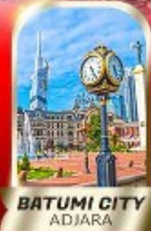
BATUMI CITY ADJARA

เมืองถ้ำอูพลิสซิค ■ ป้อมอบาบูรี ■ นั่งกระเช้าชมเมืองบอร์โจมี อนุสาวรีย์มิตรภาพ รัสเซีย-จอร์เจีย ■ โบลด์เทอร์เกตตี วิหารจวารี ■ มหาวิหารสเวทิตสเควซี