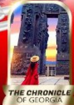
THE CHRONICLE OF GEORGIA