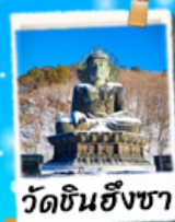
วัดชินฮังซา