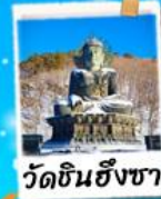
วัดชินฮึงซา