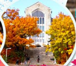
มหาวิทยาลัยฮ็ฮวา