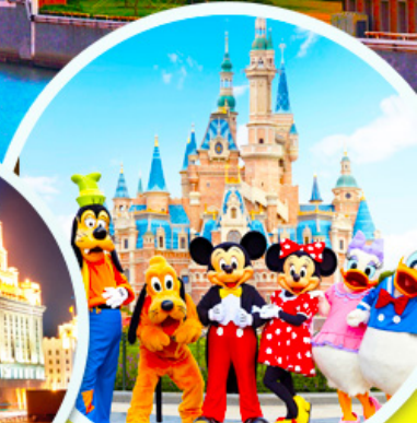
ดิสนีย์แลนด์