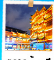
ตลาดร้อยปี