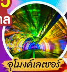
อุโมงค์เลเซอร์