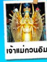
เจ้าแม่กวนอิม