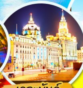
เดอะบันด์