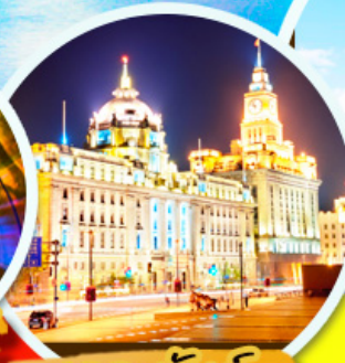
เดอะบันด์