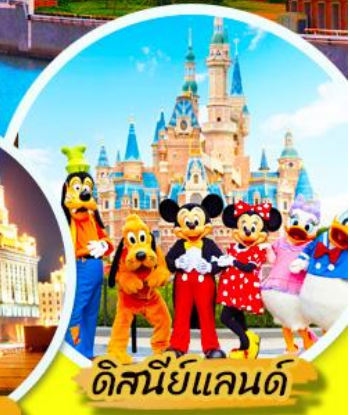
ดิสนีย์แลนด์

***เมนูพิเศษ : เสียวหลงเปา , ชาบูหม่าล่า *** เที่ยวแบบสบายๆ ไม่ลงร้านรัฐบาล ***