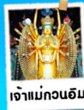
เจ้าแม่กวนอิม