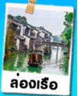
ล่องเรือ