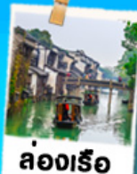
ล่องเรือ