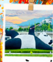
แพนด้าเซลล์