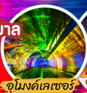
จูโมงด์เลเซอร์