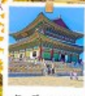
วังเคียงบกทง