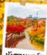
นัมซานพาร์ค