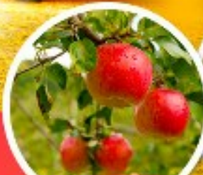
ไร่แอปเปิ้ล