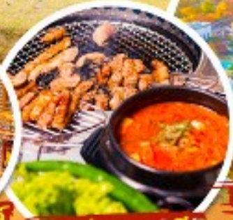
ตัวอย่างเกาหลี