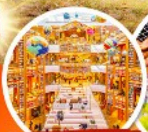
ห้องสมุดสตาร์ฟิชต์