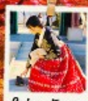
ใส่ชุดฮันบก