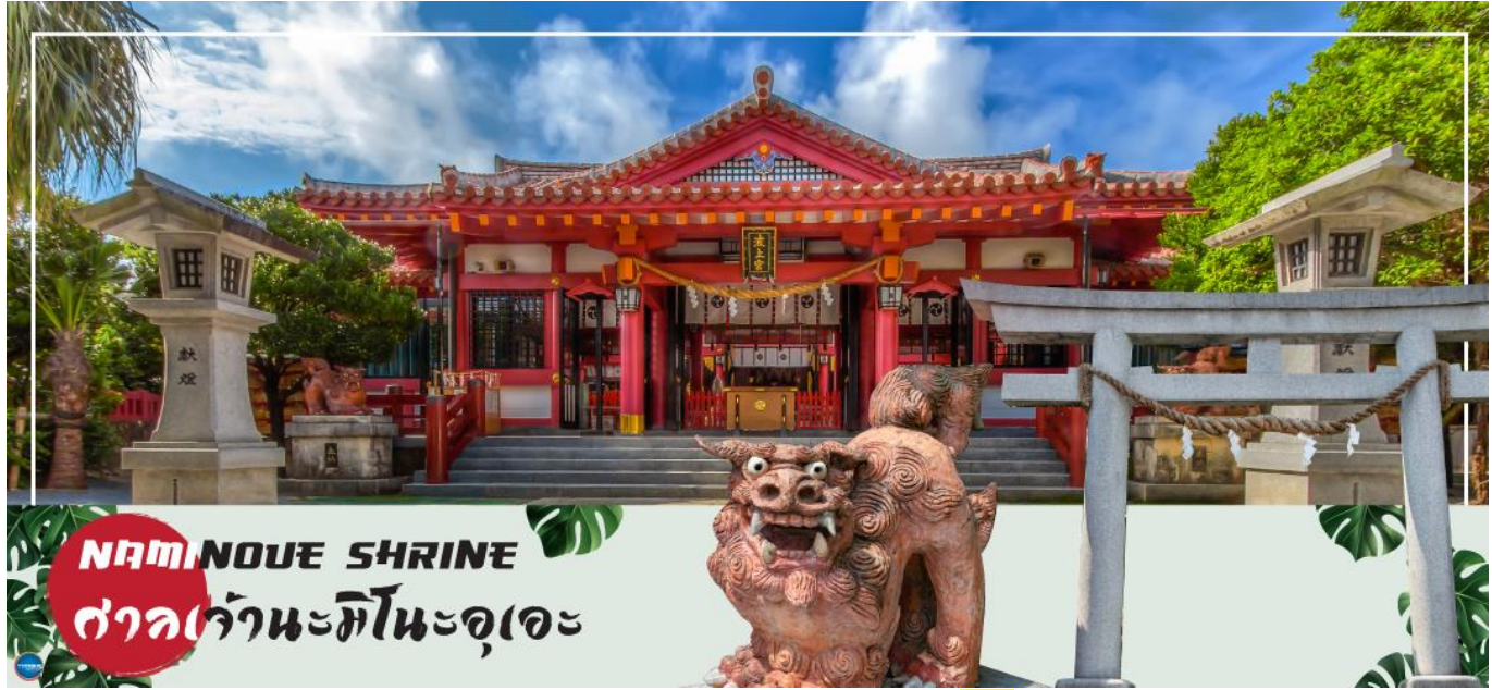
NAMINOUE SHRINE ศาลเจ้านะมิโนะอุเอะ

เช้า รับประทานอาหารเช้า ณ ห้องอาหารของโรงแรม (5) นำท่านเดินทางสู่ ศาลเจ้านะมิโนะอุเอะ (Naminoue Shrine) (ใช้เวลาเดินทางประมาณ 10 นาที) ตั้งอยู่ ณ บริเวณที่เป็นพื้นที่ศักดิ์สิทธิ์ที่ใช้ในการสวดภาวนาอธิษฐานต่อเทพเจ้าที่สถิตย์อยู่ ณ อาณาจักรเจ้าสมุทรโพ้นทะเลมาแต่ครั้งโบราณ ในอดีตชาวเรือที่เข้าออก ณ ท่าเรือนาสะ (Naha Port) ซึ่งขณะนั้นเป็นศูนย์กลางการแลกเปลี่ยนค้าขายกับนานาประเทศ ทั้งจีน ประเทศทางตอนใต้เกาหลี และชวายามาโตะ มักจะแหงนหน้ามองขึ้นไปยังศาลเจ้าซึ่งตั้งอยู่บนหน้าผาสูงเพื่ออธิษฐานและแสดงความขอบคุณ ศาลเจ้านะมิโนะอุเอะได้รับความเสียหายจากการรบในโอกินาวะ (Battle of Okinawa) เมื่อครั้งสงครามแปซิฟิก แต่ได้รับการบูรณะฟื้นฟูในเวลาต่อมาเมื่อสงครามสิ้นสุดลง ปัจจุบันนี้ได้กลายมาเป็นศูนย์กลางแห่งศาสนาชินโตในจังหวัดโอกินาวะ ชาวญี่ปุ่นมักจะมาไหว้ขอพรเกี่ยวกับธุรกิจการงานให้เจริญรุ่งเรือง ร่ำรวย และมาสะเดาะเคราะห์ให้พ้นโชคร้าย จากนั้นนำท่านสู่ เอาท์เล็ตมอลล์ อาชิบิโน่า (Okinawa Outlet Mall Ashibinaa) (ใช้เวลาเดินทางประมาณ 30 นาที) เอาท์เล็ตแห่งแรกในโอกินาวะ รวบรวมร้านค้าชั้นนำกว่า 100 ร้าน ทั้งเสื้อผ้าแฟชั่น สินค้าแบรนด์เนม นาฬิกา ข้าวของเครื่องใช้ ของเล่น ทุกร้านจัดเต็มทั้งสินค้านำเข้าและรุ่นใหม่ ลดราคากระหน่ำกว่า 30-80% ให้ได้เดินช้อปปิ้งท้ายทวีปกันอย่างจุใจ ภายใต้บรรยากาศสบายๆ สไตล์รีสอร์ทริมทะเล หากช้อปปิ้งเหนื่อยสามารถขึ้นไปทานอาหารที่ชั้น 2 มีอีกหลายร้านที่คอยให้บริการ