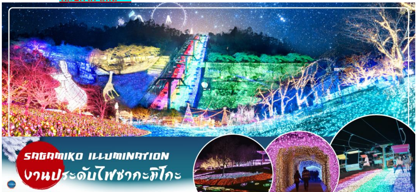
SAGAMIKO ILLUMINATION งานประดับไฟซากะมิโกะ

** ปกติงานประดับไฟซากะมิโกะ จะปิดทำการทุกวันพุธและพฤหัสบดี อังถึงจากงานประดับไฟของปี 2023 - 2024 กรณีที่กรุ๊ปเดินทางเข้าชมตรงวันหยุดของงานประดับไฟซากะมิโกะ ขอปรับเปลี่ยนโปรแกรมเป็น งานประดับไฟที่หมู่บ้านเยอรมัน (Tokyo german village) หลนแทนในวันถัดไป และที่เที่ยววันนี้จะเป็น หมู่บ้านไอชิโนะฮักโก แทน **