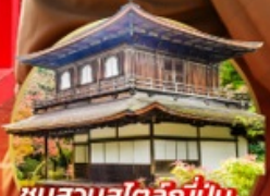
ชมสวนสโตนี่ญี่ปุ่น.. Ginkakuji Temple