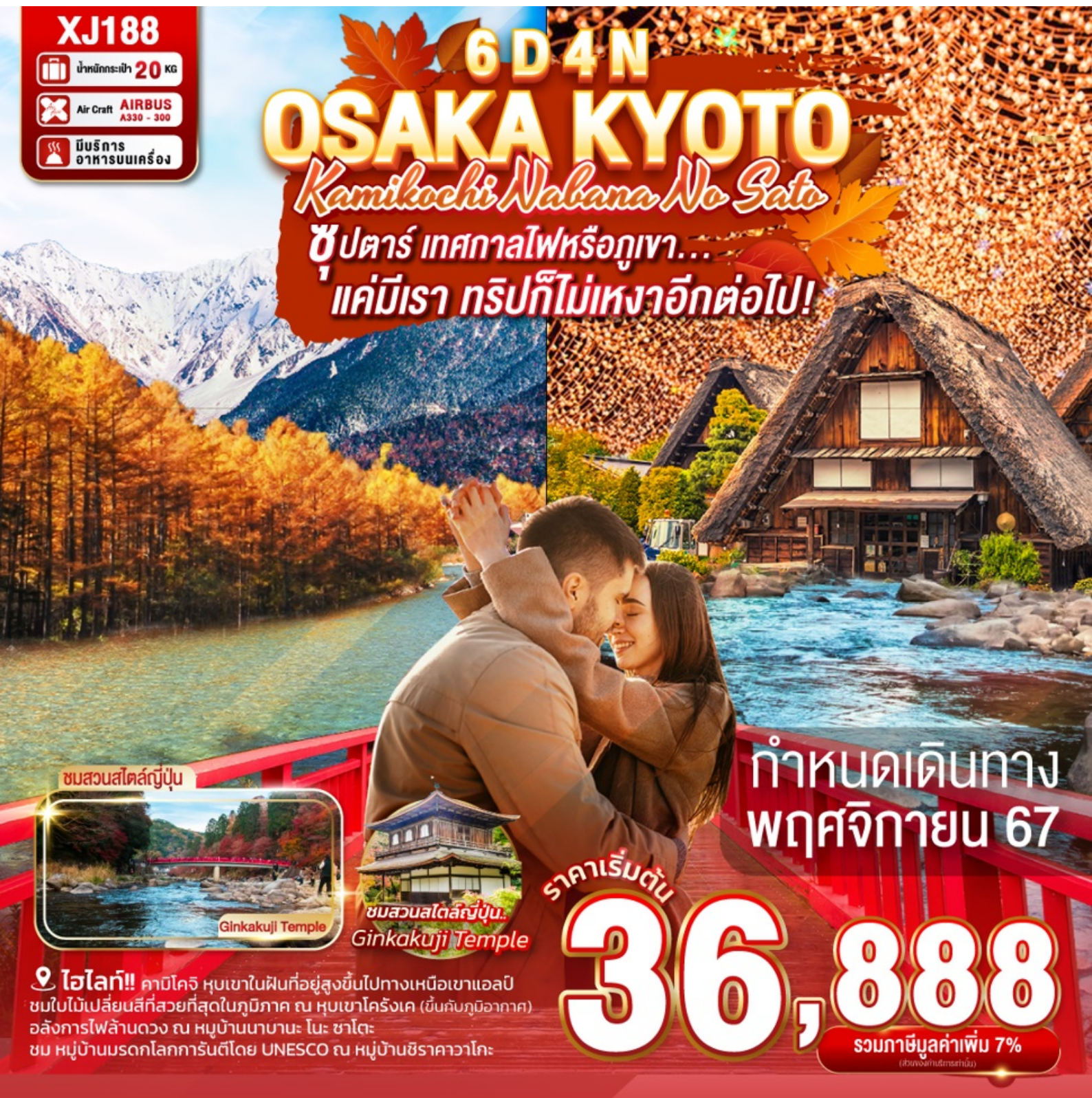
ชมสวนสโตนี่ญี่ปุ่น

ชูปตาร์ เทศกาลไฟหรือภูเขา... 'แค่มีเรา ตรีปก็ไม่เหงาอีกต่อไป!