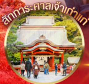
สักการะศาลเจ้าเก่าแก่