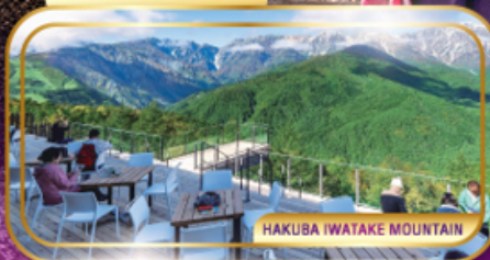
HAKUBA IWATAKE MOUNTAIN