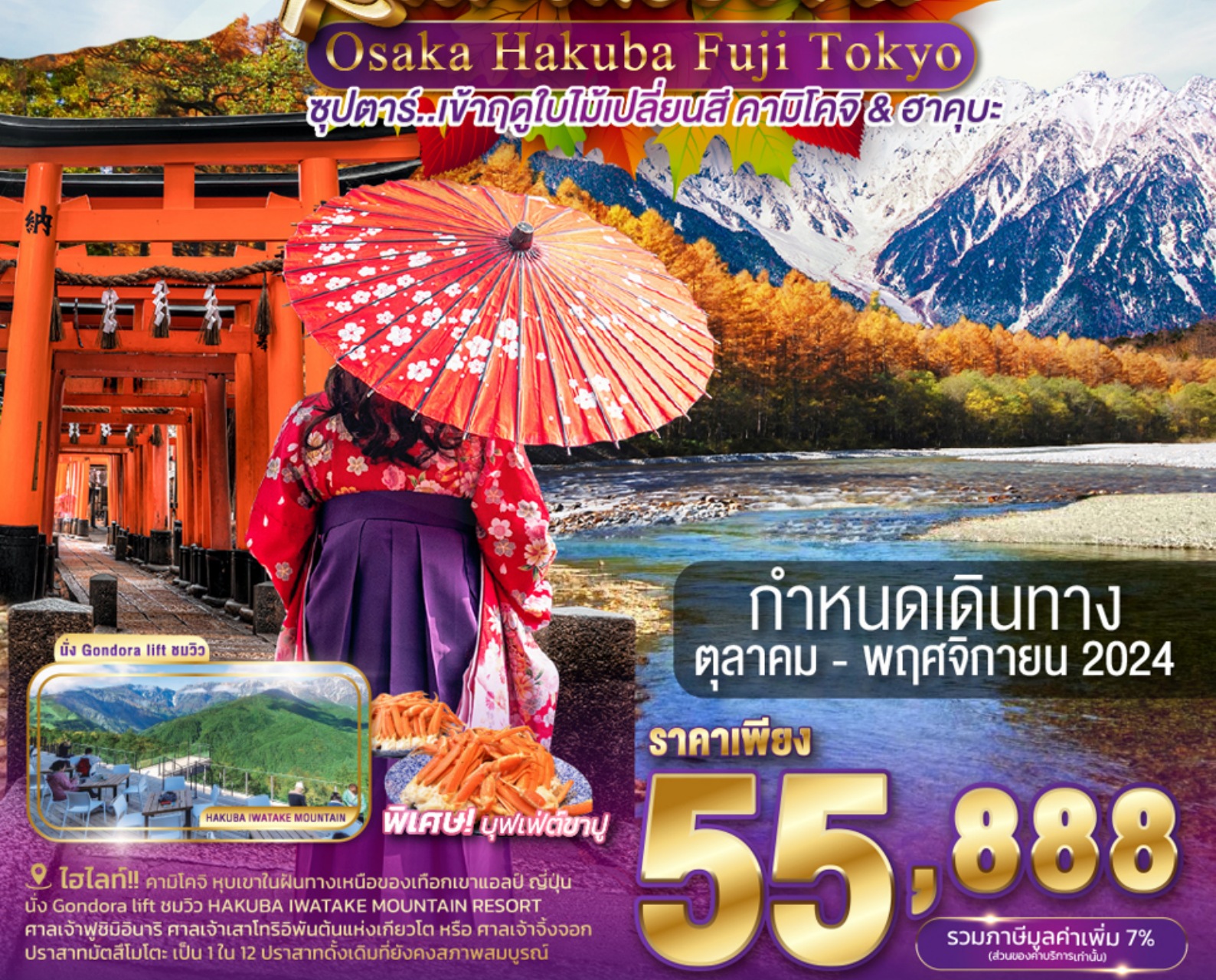
นั่ง Gondora lift ชมวิว

ซูปรคาร์..เจ้าฤดูใบไม้เปลี่ยนสี คาบิโคจิ & ฮาคุบะ