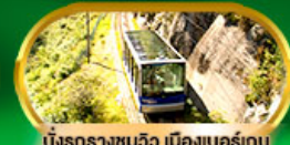
นั่งรถรางชมวิว เมืองเบอร์เกน