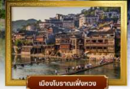
เมืองโบราณเฟิ่งหวง