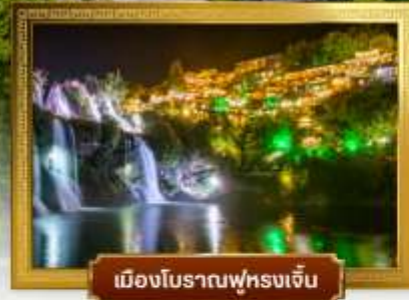
เมืองโบราณฟุหรงเจิน