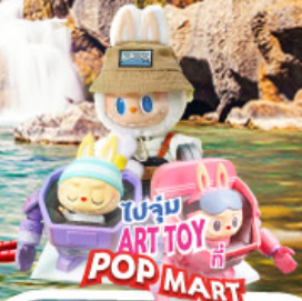
ไปลุ้น ART TOY ที่ POP MART