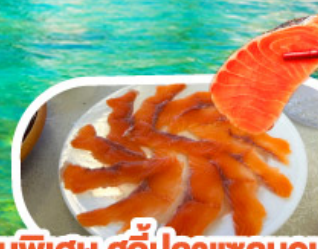
เมนูพิเศษ สุกีปลาแซลมอน สุกีเห็ด อาหารกวางตุ้ง