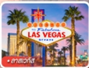
ลาสเวกัส