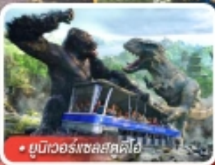
ยูนิเวอร์สอลสตูดิโอ