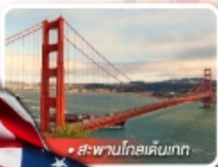
สะพานโกลเด้นเกต