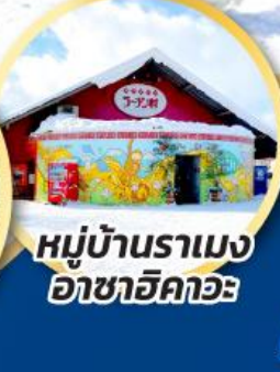
หมู่บ้านราเมง อาซาฮิคาวะ

ชมความน่ารักของน้องๆ ที่สวนสัตว์อาซาฮิคาวะ