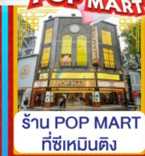
ร้าน POP MART ที่ซีเหมินติง