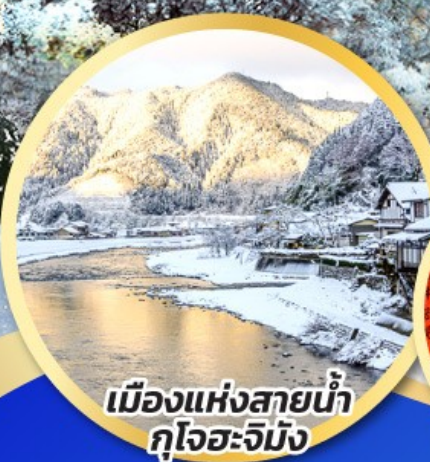
เมืองแห่งสายน้ำ กุโจะจิมัง