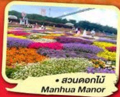
• สวนดอกไม้ Manhua Manor