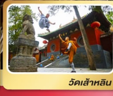
วัดเส้าหลิน