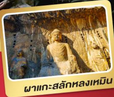
ผาแกะสลักหลงเหมิน