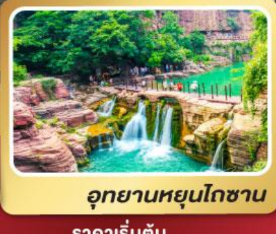
อุทยานหยุ่นโกซาน