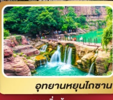
อุทยานหยุนโกซา