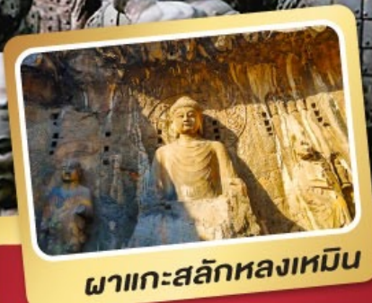
พาเกาะสลักหลงเหมิน