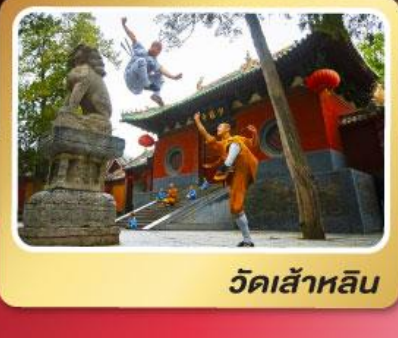
วัดเส้าหลิน