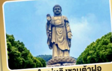
พระใหญ่หลิงซานต้าฝอ

เมนูพิเศษ! ซีโครงหมูอู๋ซี, เสี่ยวหลงเปา, ชาบูหมาล่า