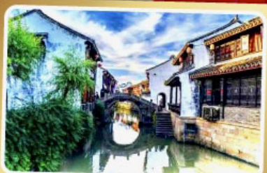
เมืองโบราณเยี่ยเหอ