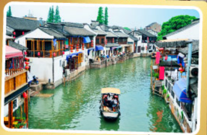
เมืองโบราณจูเจียเจียว