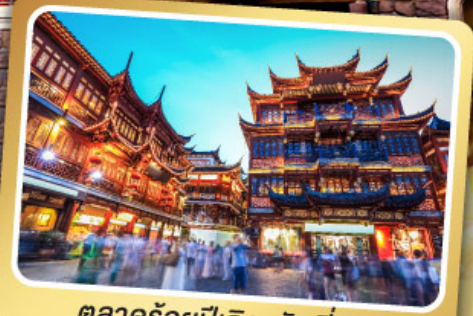
ตลาดร้อยปีเฉิงหวังเหมียว