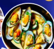
หอยแมลงภู่อินทรีย์