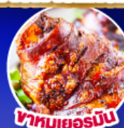
พาหมูเยอรมัน