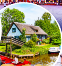
หมู่บ้านกังธูร์น