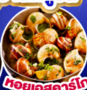
หอยเอสคาร์โก

เดินทาง 11-19 ต.ค.67/ 14-22 พ.ย.67 25 ธ.ค.67 - 2 ม.ค.68(เทศกาลปีใหม่)