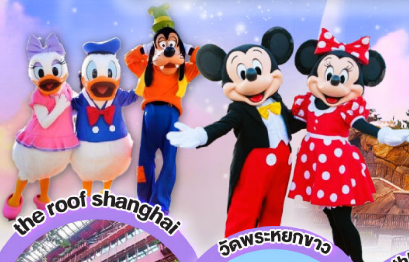
the roof shanghai