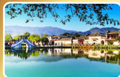
หมู่บ้านผดกโลก หงซุน