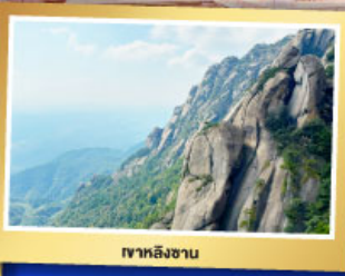
เขาหลิงซาน