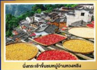
นั่งกระเช้าขึ้นชมหมู่บ้านหวงหลิง