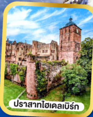
ปราสาทไฮเคลเบิร์ก