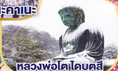
หลวงพ่อดโตโดบตล