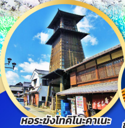
หอรบั้งโทคิโนะคานะ