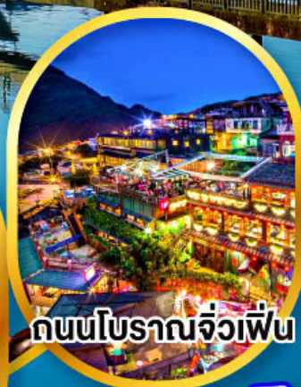
ถนนโบราณจิวเฟิ่น