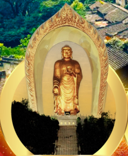
พระใหญ่ตงหลิง