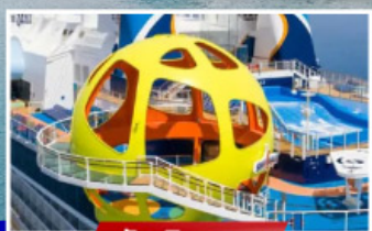
วันเดินทาง