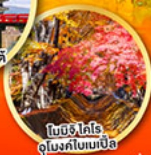
โมมิจิ ไคโร อุโมงค์ไบเมเปิล