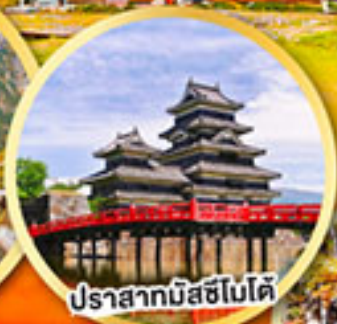
ปราสาทมัสชิโมโด้