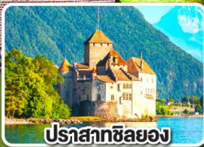
ปราสาทซิลยง