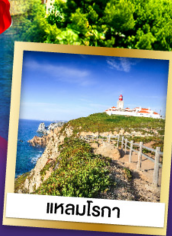
แหลมโรกา