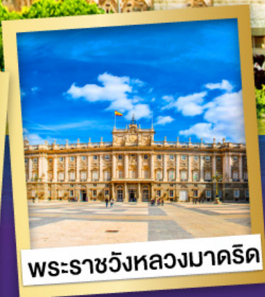
พระราชวังหลวงมาดริด