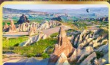
• หุบเขานกพราบบ