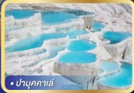
• ปามุกคาเล่