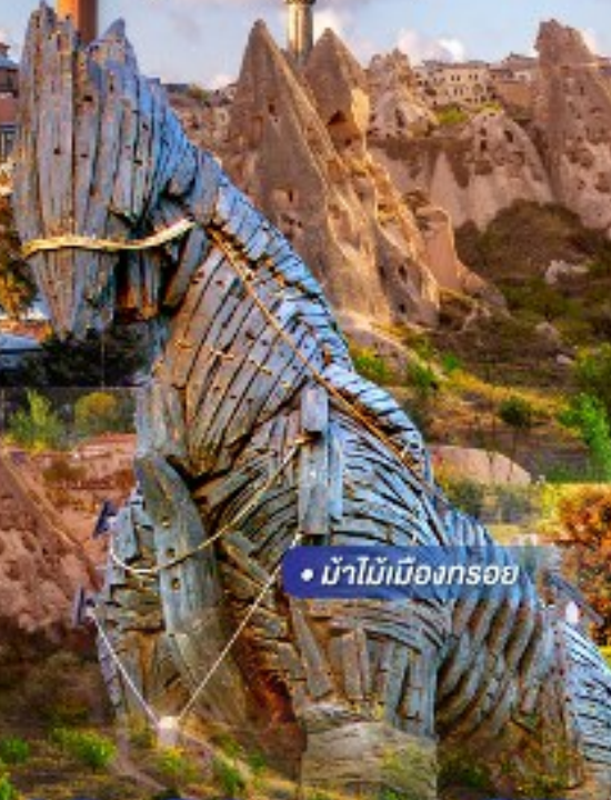
• นำไม้เมืองทรอบ