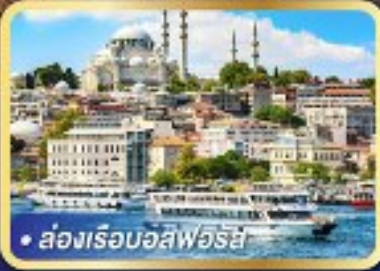
• ส่องเรือบอสฟอริส